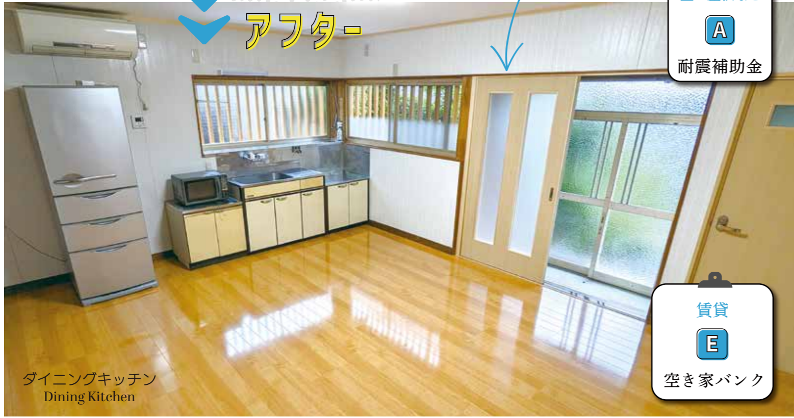
ダイニングキッチン Dining Kitchen